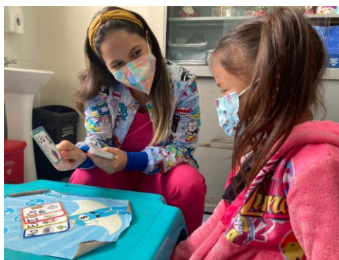
Imagen: Atención en consulta externa de Salud Mental

Elaborado por: Planificación, Seguimiento y Evaluación de la Gestión