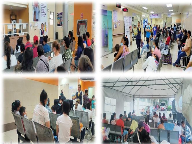
Imagen: Charlas impartidas por Educadoras para la Salud en salas de espera HFIB

Fuente: Gestión de Atención al Usuario – Educación para la Salud Elaborado por: Planificación, Seguimiento y Evaluación de la Gestión